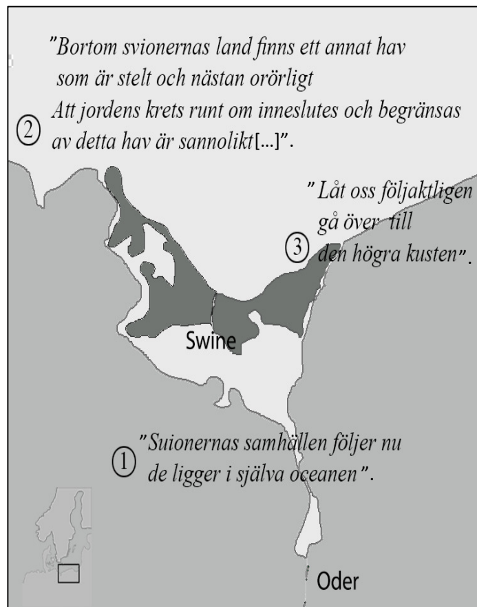
Fig. 3 Tacitus text i ordningen 1 – 2 – 3.